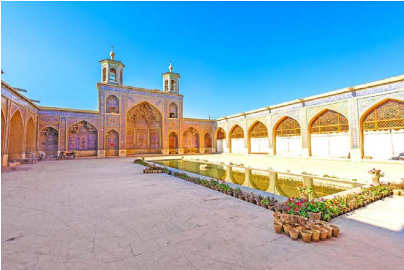
Mosquée Nasir-al Molk à Shiraz Photo 11/12

La mosquée Nasir-al Molk et ses somptueux vitraux multicolores est un des nombreux trésors architecturaux dont regorge Shiraz, berceau de la culture persane et capitale culturelle et artistique de l'Iran.