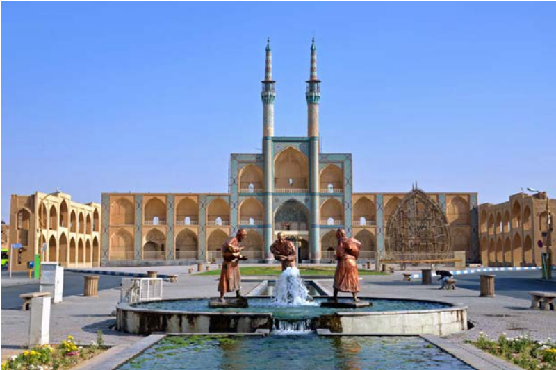
Complexe Amir Chakhmagh, à Yazd Photo 2/12

Le complexe Amir Chakhmagh abrite une mosquée, un bazar, un caravansérail ainsi qu'un impressionnant tekiyeh (lieu de commémoration du martyr de l'imam Hossein). L'ascension d'un de ses minarets offre un panorama d'une incroyable beauté sur la ville multi-millénaire de Yazd.