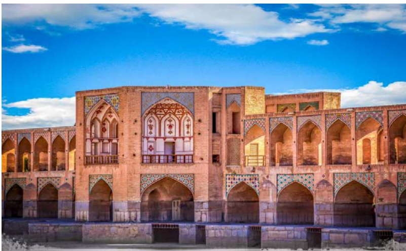
Pont Khaju à Ispahan Photo 6/12

Comptant parmi les plus grandes places du monde, Naghsh-e Jahan, qui portait autrefois le nom de place du Shah, permet d'admirer plusieurs monuments classés au patrimoine mondial de l'humanité.