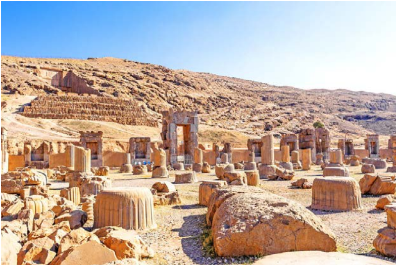
Vestiges millénaires de Persépolis Photo 8/12© JPAaron | Fotolia

Fondée par Darius Ier en 518 avant notre ère, Persépolis est un site unique et incontournable de par l'importance et la qualité de ses vestiges monumentaux.