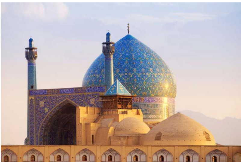
Mosquée de l'Imam, à Ispahan Photo 7/12© Tunart | iStock

Le pont Khaju à Ispahan, monument majeur de l'architecture des ponts persans, a été construit par le roi safavide Shah Abbas II au XVIIe siècle. C'est un des lieux préférés des Esfahanis.