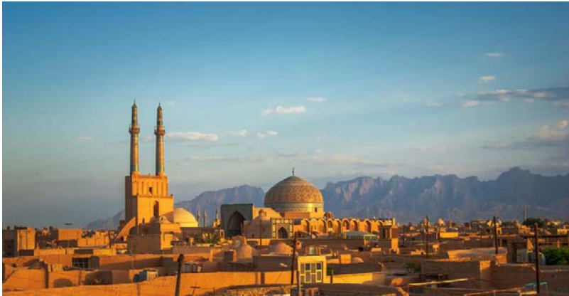
Yazd, dans le centre de l'Iran Photo 1/12

Iran : sur les traces d'une culture millénaire