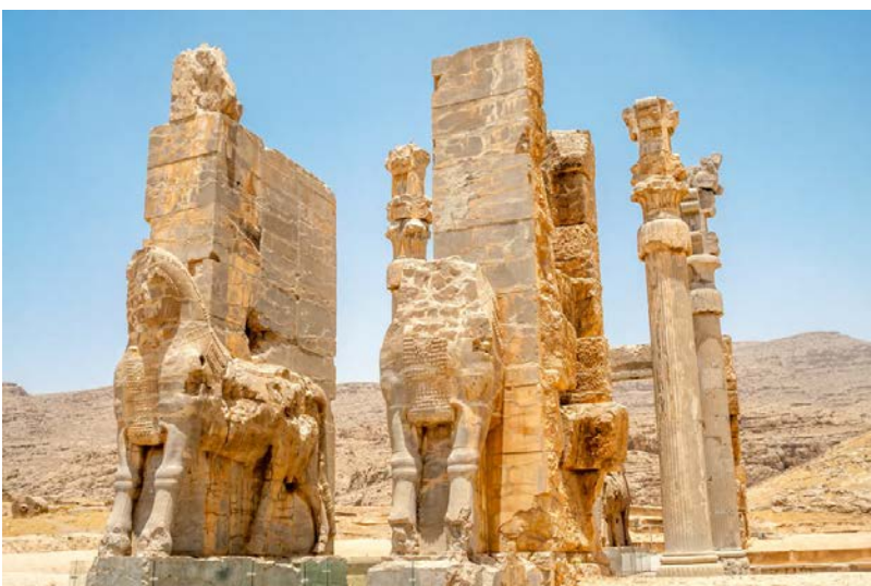
Porte des Nations (ou Porte de Xerxès), à Persépolis

Fondée par Darius Ier en 518 avant notre ère, Persépolis est un site unique et incontournable de par l'importance et la qualité de ses vestiges monumentaux.