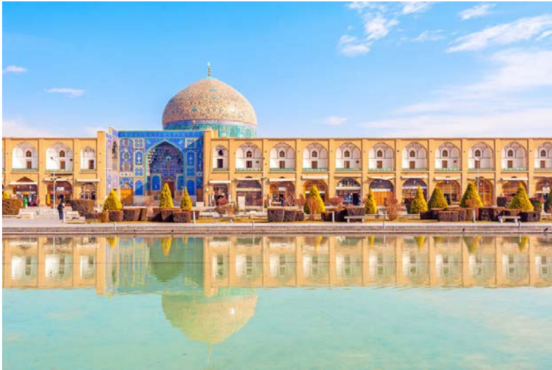
Place Naghsh-e Jahan et mosquée du Sheikh Lotfallah à Ispahan Photo 5/12

Comptant parmi les plus grandes places du monde, Naghsh-e Jahan, qui portait autrefois le nom de place du Shah, permet d'admirer plusieurs monuments classés au patrimoine mondial de l'humanité.