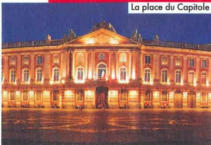
La place du Capitole

30, rue du Rempart-Saint-Étienne, Toulouse. Tél. : 05 61 21 15 81.