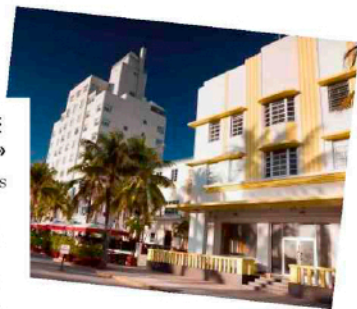
← District Art déco à SoBe

On dit que Naples doit son nom à la beauté de sa baie. Créée par un milliardaire à