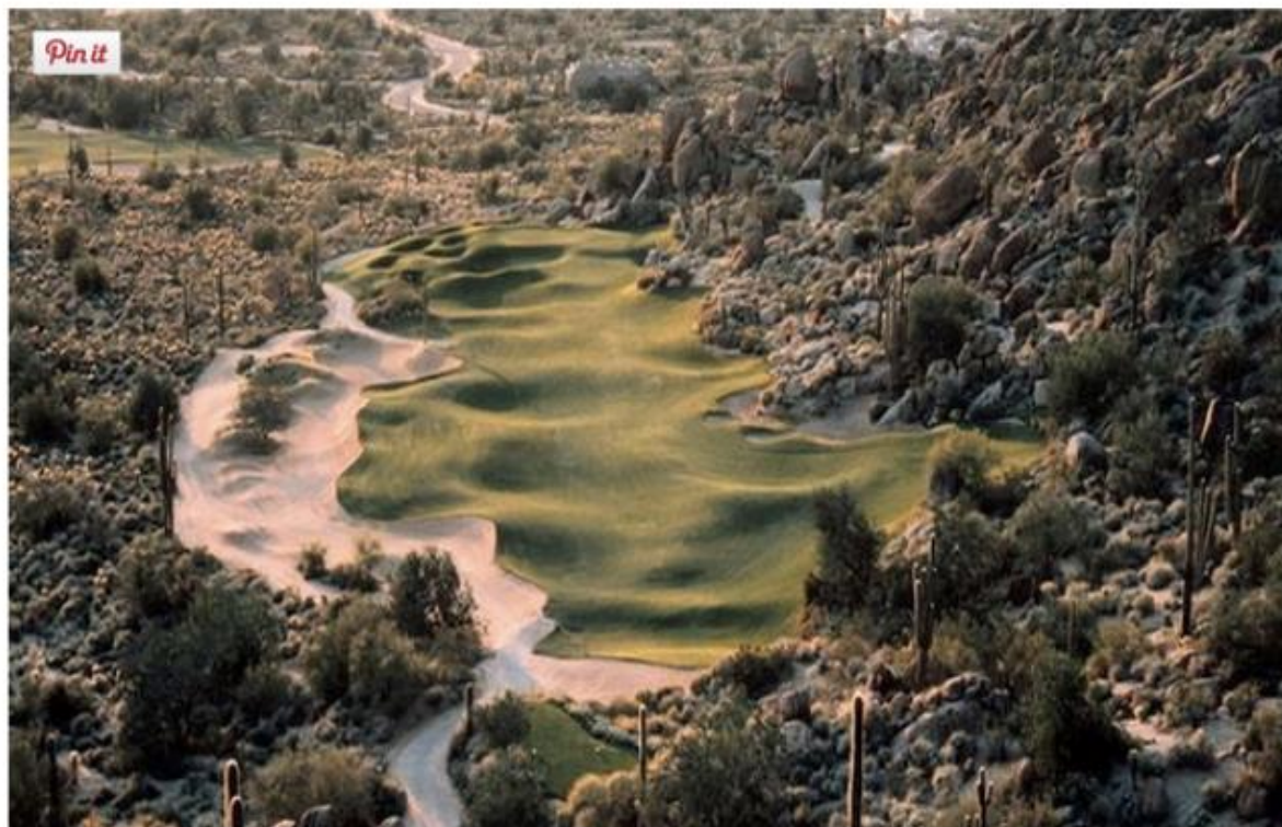
Le parcours de Desert Highland

Décor de film grandeur nature par excellence, le désert de Sonora s'étend entre les États-Unis et le Mexique , en plein cœur de l' Arizona mais aussi de la Californie . Conçu par le célèbre Jack Nicklaus , ce parcours de golf atypique se dévoile en plein désert, bordé par une horde de cactus, rochers et autres végétaux hors normes.