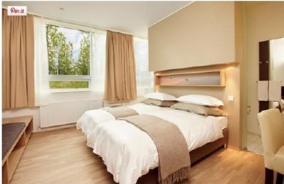
Une chambre du Icelandsir hotel