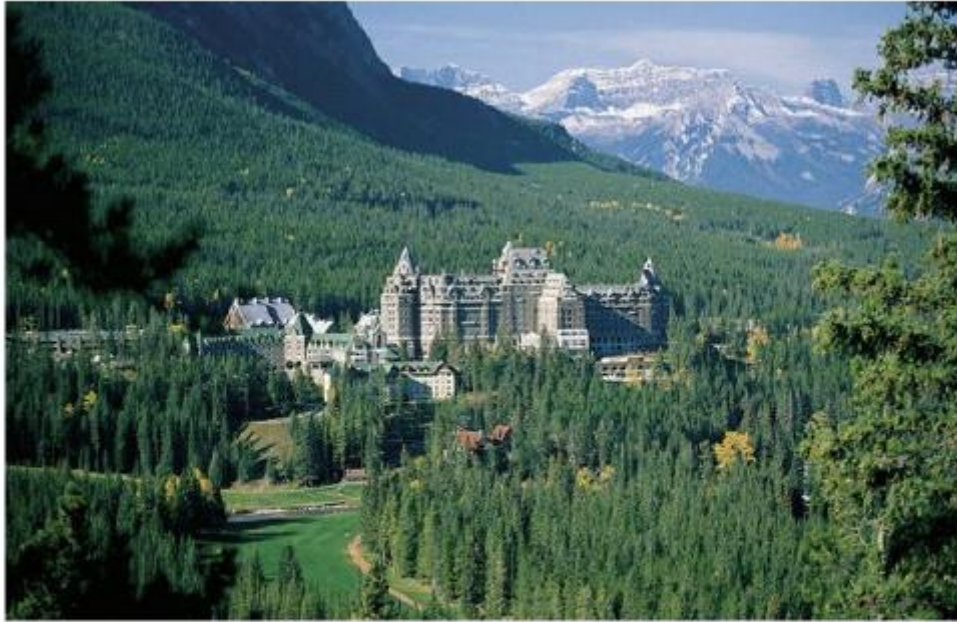
L'hôtel Fairmont Banff Springs