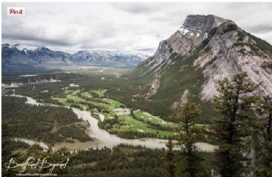
Le parcours de golf en contrebas

Direction la province d' Alberta au Canada où la petite commune de Banff accueille un parc national classé au patrimoine de l' UNESCO en plein cœur des Rocheuses . Là, face à l'hôtel Fairmont Banff Springs , le parcours de golf de Tunnel Mountain vous attend entre conifères géants et montagnes majestueuses. Après la découverte des deux parcours 9 trous du golf, le Fairmont Banff Springs vous accueille dans son décor inspiré d'un château seigneurial écossais. Atypique.