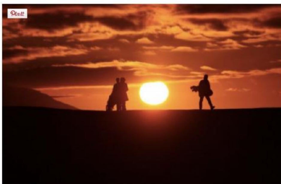
un décor de rêve pour golfer

Tous les joueurs de la planète en quête d'instant magiques se donnent rendez-vous sous le soleil de minuit du golf d'Akureyri en Islande. Après un parcours riche en obstacles où tous les sens sont en éveil, on se repose dans l'une des chambres du Icelandair , un hôtel ravissant tout de bois vêtu.