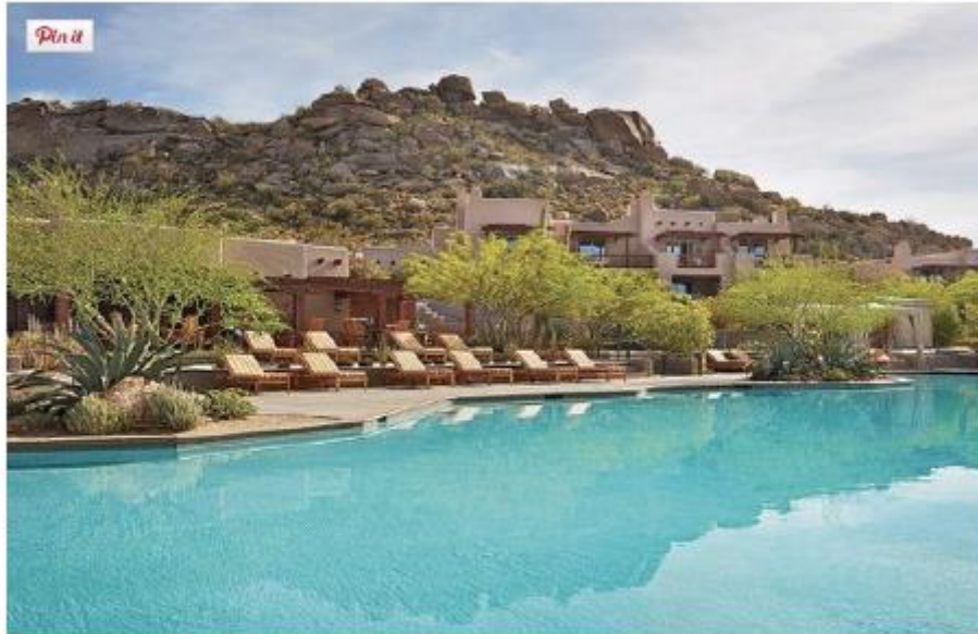
Le Four Seasons Scottsdale

Après l'effort le réconfort puisque le golf accueille également un centre de fitness et des piscines. Pour se loger, on optera pour les suites Sonoran Casita du Four Seasons Resort avec leurs vues sur les contreforts de Crescent Butte Mountain .