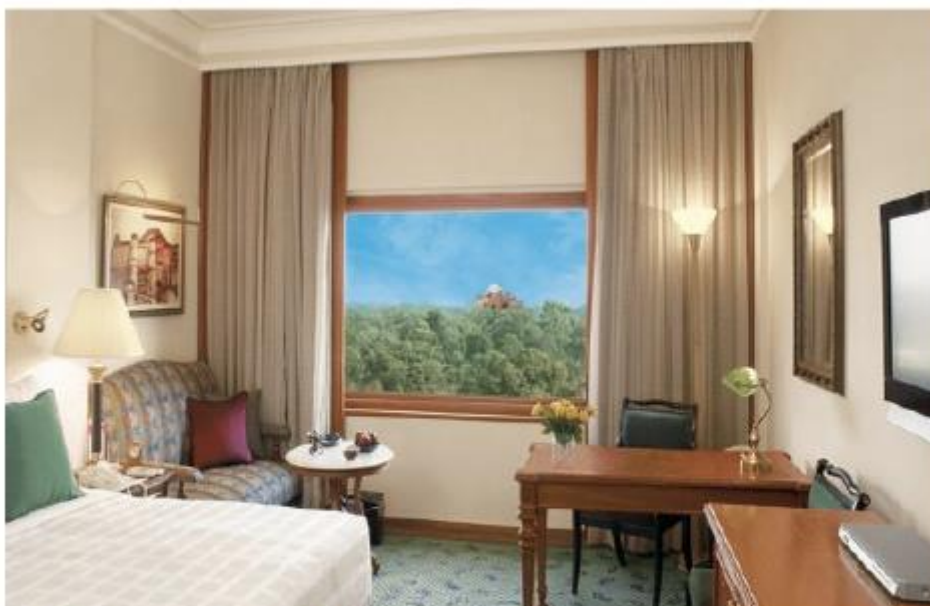
Chambre avec vue à l'Oberoi New Delhi