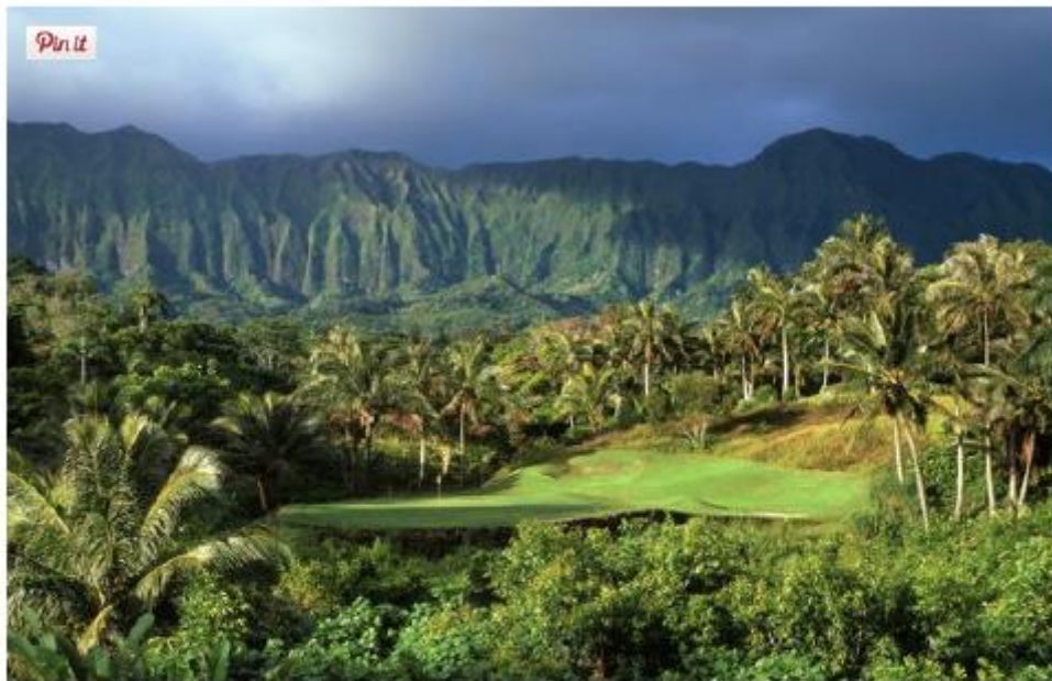
Un parcours paradisiaque