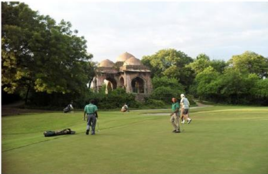
le parcours du Lodhi Golf Club

Parcours réputé de la ville de Delhi , ce golf dessiné par Peter Thomson existe depuis 1950. On aime tout particulièrement sa végétation exotique et ses temples hindous disséminés tout au long des 18 trous. Pour mieux l'appréhender, on organisera un séjour de quelques nuits dans les environs à l' hôtel Oberoi New Delhi par exemple.