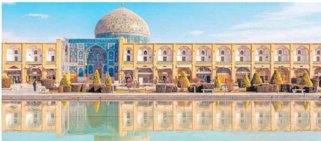
La ville d'Isfahan en Iran » 10